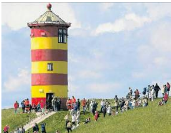
Föörtoorn in Pilsum.

Radio Oostfriesland - „heel wat Besünners!“ Nachrichten up Platt sünd elker Dag in 't Internet to hören ünner neu.radio-ostfriesland.com/player.php . 's Middags um twalv un üm halv een.