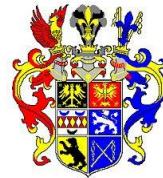
Eala Frya Fresena

Arbeitsgemeinschaft der Butenostfriesenvereine in Nordrhein-Westfalen